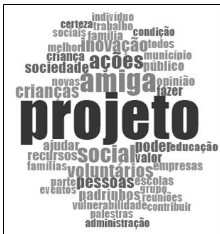
Figura – 1 Nuvem de palavras